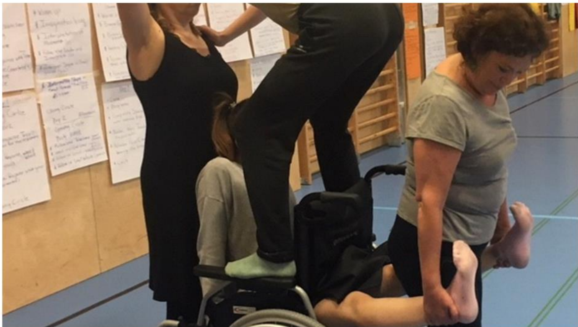
hochgeladen von Gabriela Stockmann