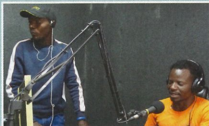
Zongwe FM, ein verbindender Radiosender in Sambia, konnte errichtet werden.