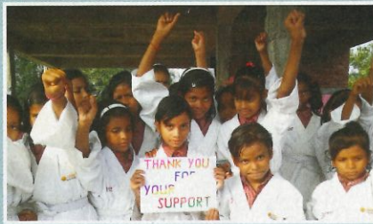
Karatekurse für Mädchen als Empowermentmaßnahme in Indien