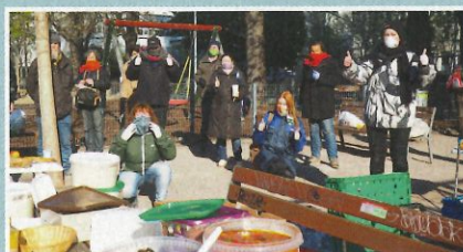
Frühstück im Park für Obdachlose in Wien