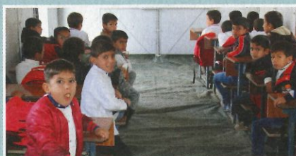
Shelter Project: mobile Schul- und Lebensräume für Menschen auf der Flucht